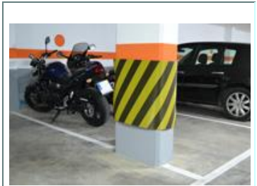
Colores disponibles :

Medidas: Alto 70 Cm x grueso 2 Cms. X 25 Mts.largo (mínimo 1 metro)