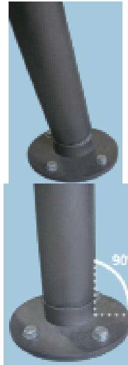
PILONA VERTICAL INCLINADA