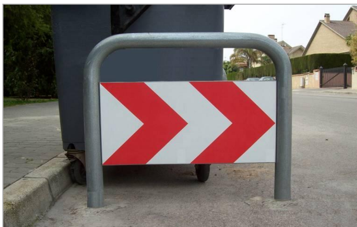
Protection benne à ordures