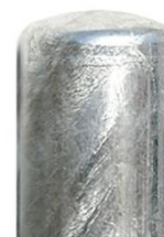
Pommeau Bombé Ø 168 mm