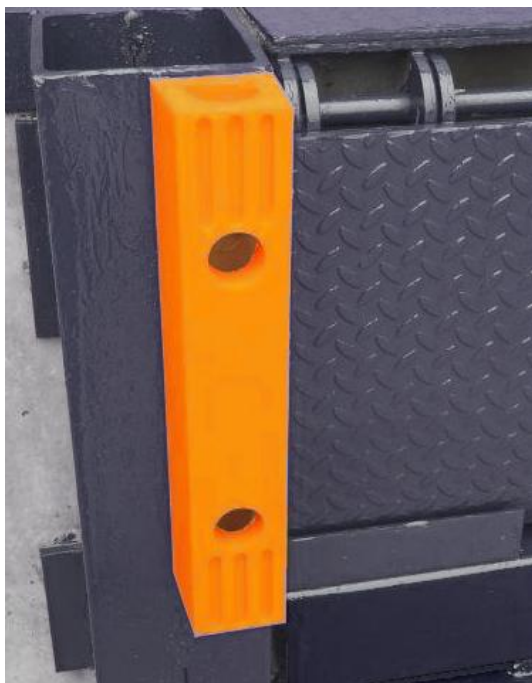
Protección muelle de carga y descarga