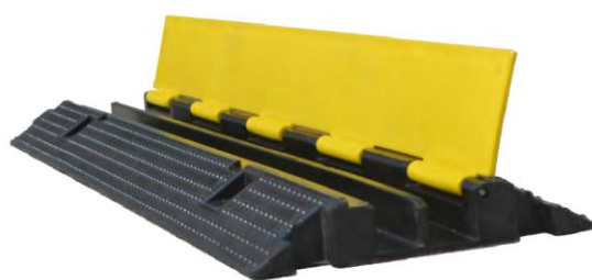
Pasacables 2 canaletas

Cumple Reglamento (CE) nº 1907/2016 (REACH)